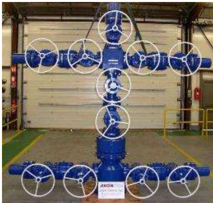
Árbol de Navidad API 6A PSL3 PR2