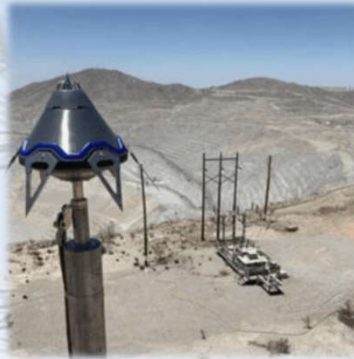
Sistema de Protección