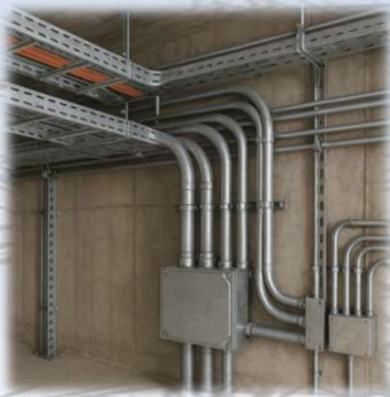
Sistema de Canalizaciones