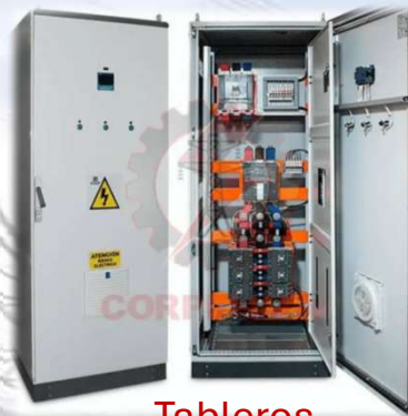
Tableros Distribución Eléctrica