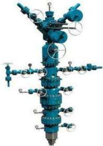
Árbol Inyector 3KSI PSL1 PR1