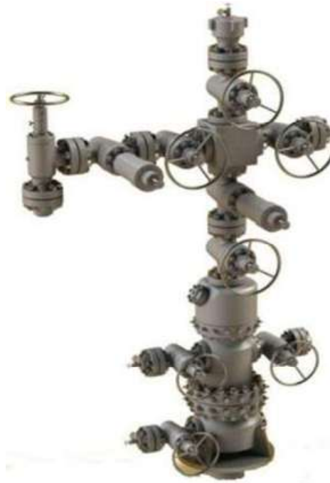
Cabezal Estándar 5 KSI API 6A PSL3G